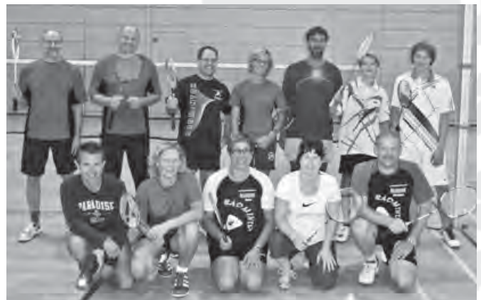
Unsere Mannschaft in der Freizeitrunde

Auch in der vergangenen Saison konnte sich unser Team zum wiederholten Mal die Meisterschaft in der Freizeitrunde Hohenlohe-Franken sichern. Allerdings war die Dominanz unserer Spieler bei weitem nicht mehr so deutlich wie in den vergangenen Jahren. Vor allem im Damenbereich kam es immer wieder zu personellen Engpässen. Als beim Rundenabschluss der TSV Schrozberg aufgrund der dünnen Spielerdecke keine Mannschaft mehr melden konnte, wurde die Idee einer Spielgemeinschaft zwischen Wallhausen und Schrozberg geboren. Die Eckpunkte der neuen Spielgemeinschaft waren schnell gefunden: