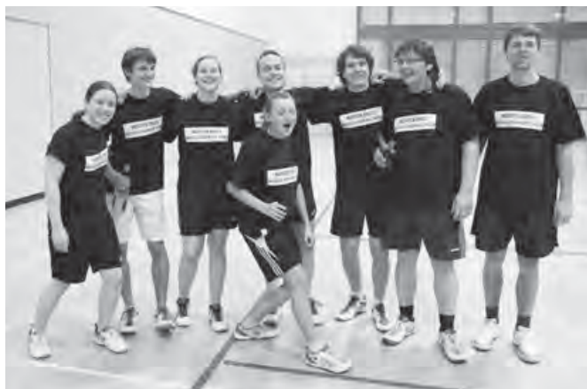
Meister in der Kreisliga Tauber-Hohenlohe

Groß war natürlich die Nervosität zu Beginn der laufenden Saison 2011/12. Würde die junge Truppe auch in der Bezirksliga spielerisch mithalten können oder musste man gleich um den Abstieg bangen? Hatte man es in der Bezirksliga doch mit Mannschaften wie Wertheim, Künzelsau, Schwäbisch Hall, Walldürn oder Tauberbischofsheim zu tun. Mittlerweile kann man sicher sagen, dass sich unsere Mannschaft auch in der Bezirksliga etabliert hat. Nach Abschluss der Vorrunde steht das Bad-