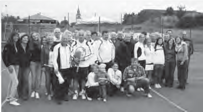
Die Teilnehmer des Nachbarschaftsturniers

Bei unserem Nachbarschaftsturnier war wieder eine sehr gute Beteiligung und so gab es tolle Spiele zu sehen. Es war ein großartiges und tolles Turnier für die Tennisabteilung.