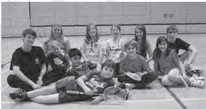
Die Badminton-AG 2011