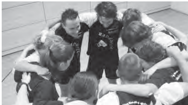
Der Mannschaftsgeist wird beschworen

Mit dem Training allein ist es natürlich nicht getan: eine erfolgreiche Mannschaft braucht auch einen Mannschaftsgeist, viel Begeisterung und Siegeswil-