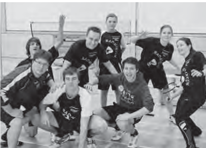
Die erfolgreiche aktive Mannschaft

Nichtsdestotrotz ist der Zusammenhalt in der Mannschaft ungebrochen, was sich auch am guten Trainingsbesuch am Dienstag- und Donnerstagabend zeigt. Die Mannschaft geht mit gutem Optimismus in die Rückrunde. Vielleicht ist ja sogar der eine oder andere Punkt gegen den souveränen Herbstmeister TSV Künzelsau möglich.