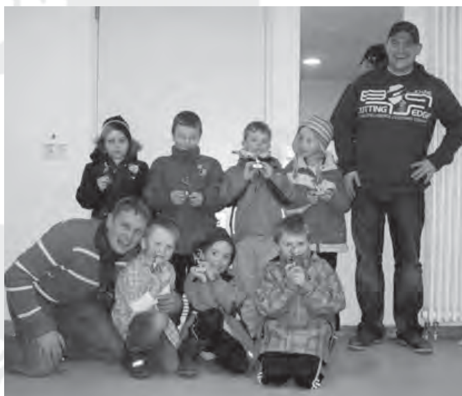
Das Bild zeigt die erfolgreiche Mannschaft mit den beiden Trainern beim Hallenturnier in Rot am See.

Unsere Bambinis mit zwölf Buben und zwei Mädels blicken auf einige abwechslungsreiche und spannende Turniere zurück. Wir nahmen an drei Hallen- und drei Feldturnieren teil. Uns Trainern macht die Arbeit mit den Kleinen viel Spaß, allerdings kosten die vergebenen Torchancen bei den Turnieren auch