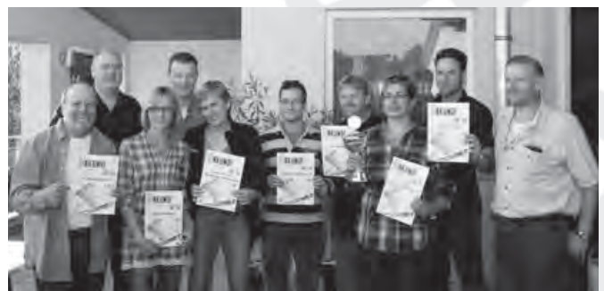
Der Rundenabschluss in der Freizeitrunde

Das Training wird in beiden Orten angeboten und die Heimspiele gegen die Mannschaften aus dem Taubertal finden in Schrozberg statt während die restlichen Begegnungen in Wallhausen ausgetragen werden.