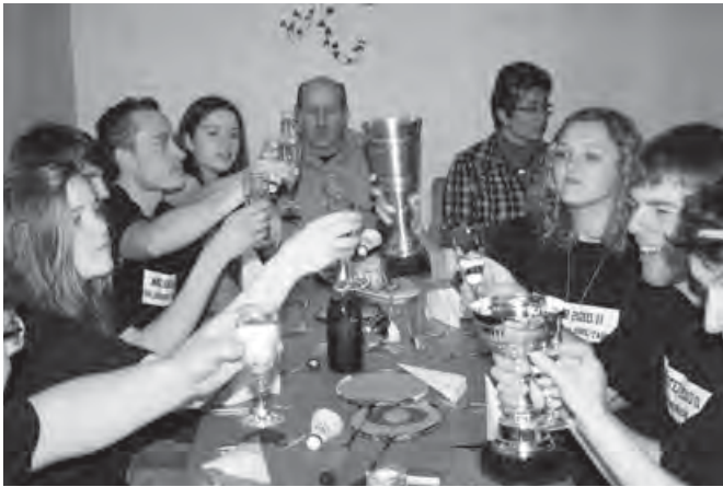
Die Meisterschaft wird gefeiert

mintonteam mit 8:2 Punkten auf dem 2. Tabellenplatz und sicherte sich somit die Vize-Herbstmeisterschaft in der Badminton Bezirksliga Hohenlohe. Allerdings musste man auch erfahren wie eng Sieg und Niederlage beieinander liegen können. Wurde beispielsweise am 2. Spieltag der TV Wertheim noch am Nachmittag mit 7:1 deutlich geschlagen, so musste das Team am Abend gegen den Tabellenführer aus Künzelsau eine empfindliche Niederlage mit 1:7 hinnehmen. Mit dieser Niederlage war eine lange Siegesserie gerissen und einige wurden wieder auf den Boden der Tatsachen zurückgeholt. Man musste erkennen, dass die Trauben in der Bezirksliga doch etwas höher hängen.