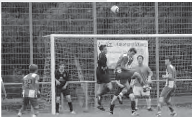
Pokal-Finale unserer Jungs gegen SC Michelbach/Wald

SSV Schwäbisch Hall war ein richtiger Pokalfight. Im Finale, das nichts für schwache Nerven war, trafen wir auf Michelbach /Wald und mussten hier als Klassenniederer auch noch auswärts in Michelbach antreten.